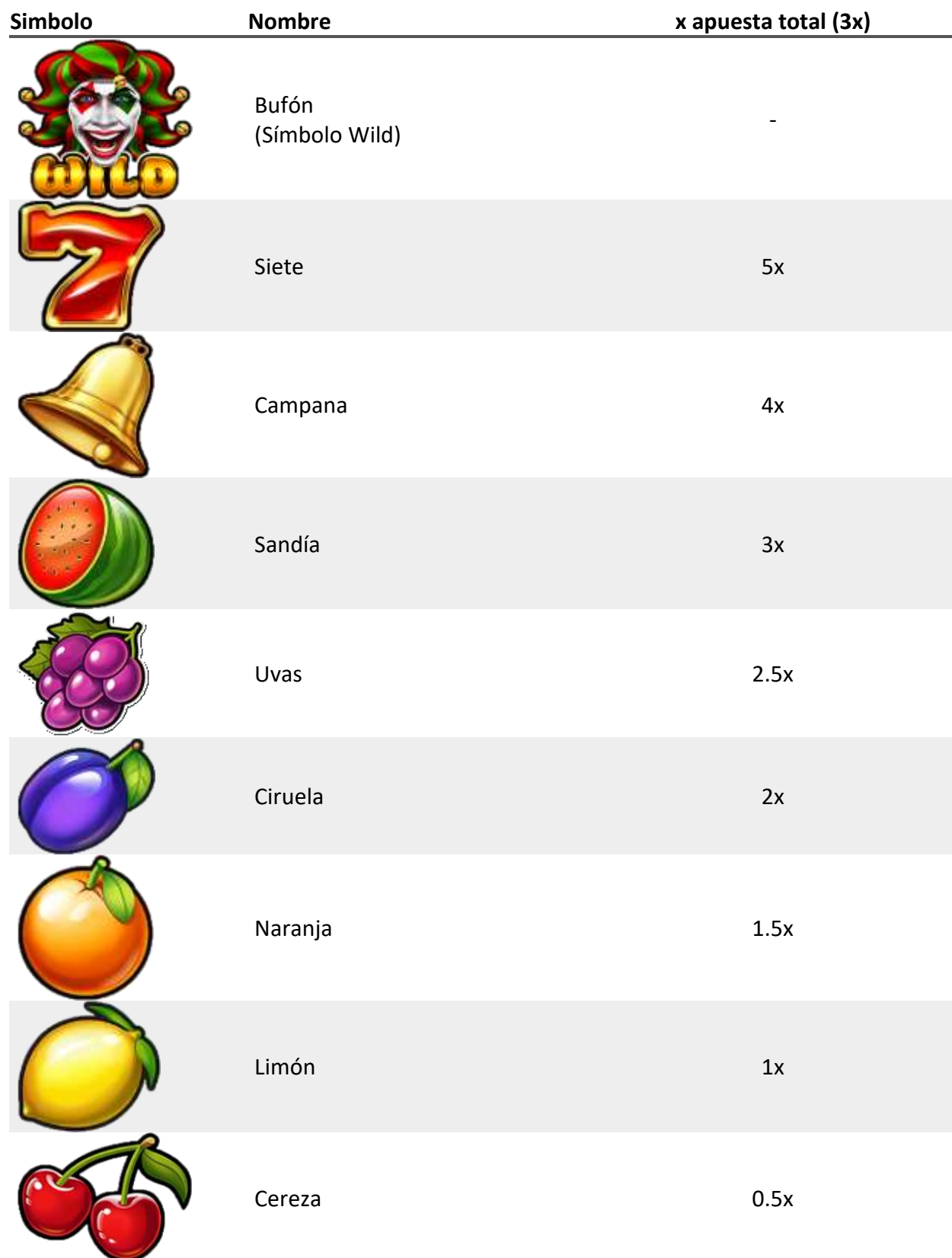
TABLA DE PAGOS