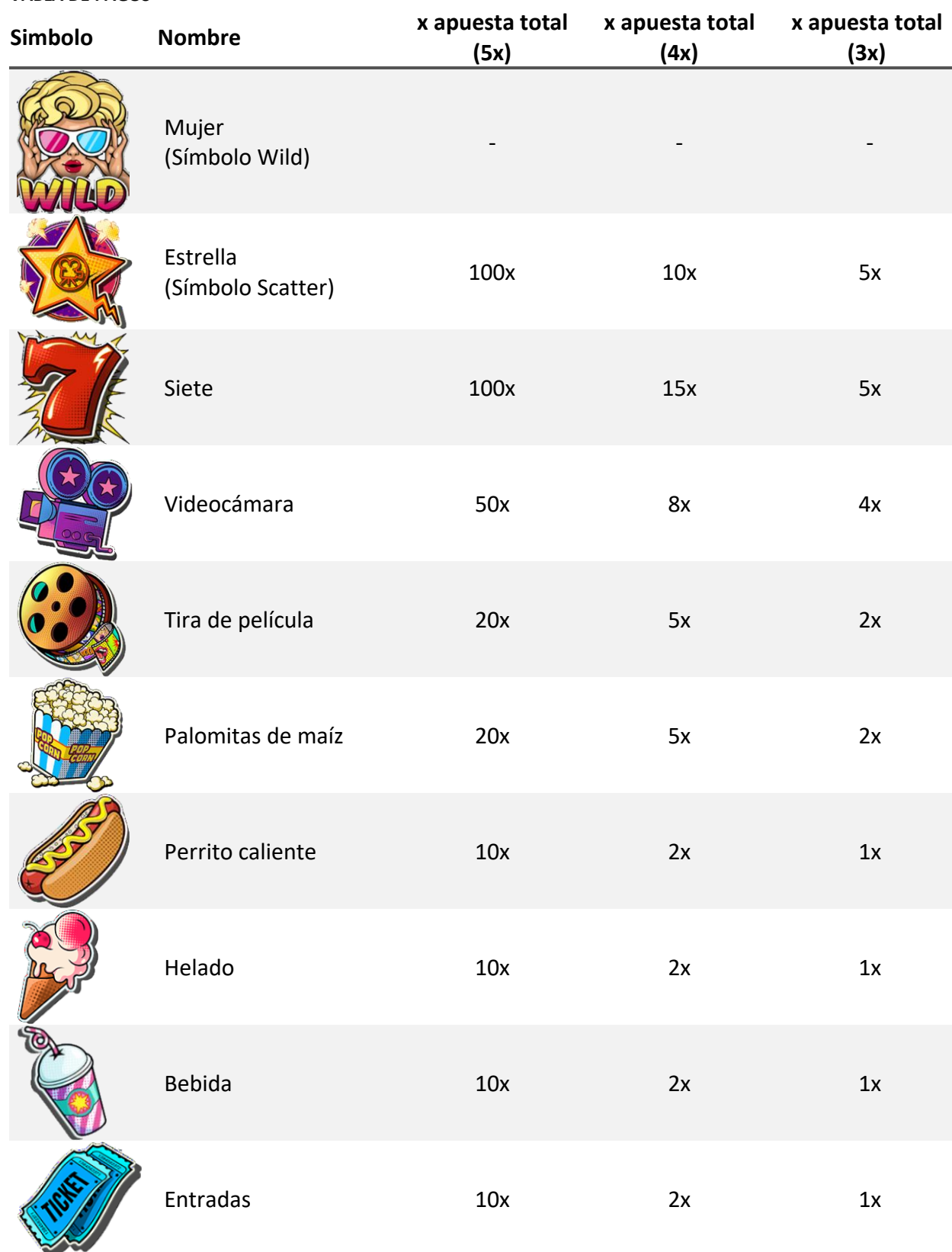
TABLA DE PAGOS