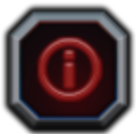
Tabla de pagos

Haga clic para ver las reglas del juego.