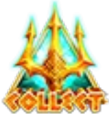
Símbolo de Collect