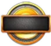
Símbolos de moneda