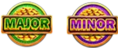
Símbolos de bonificación

Consiga un símbolo de Collect para activar la función Collect del juego base.