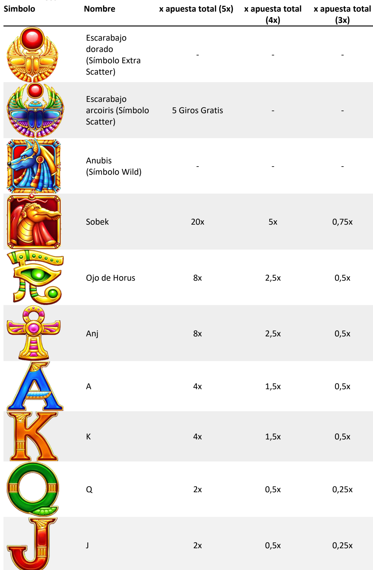
TABLA DE PAGOS