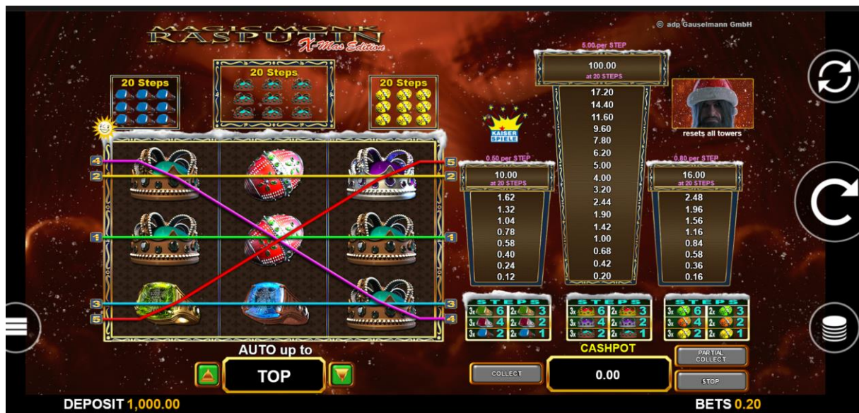
Gamedesign & Paytable