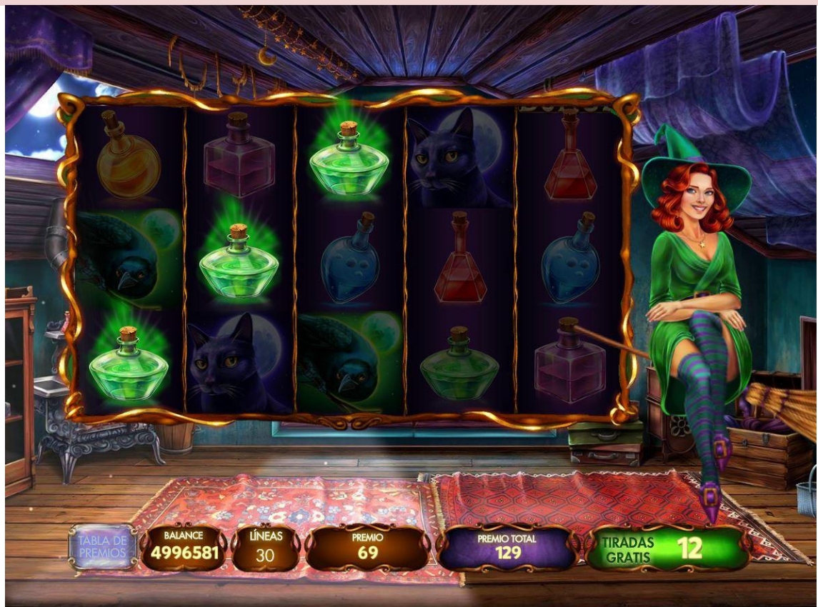
Wilds del libro de hechizos