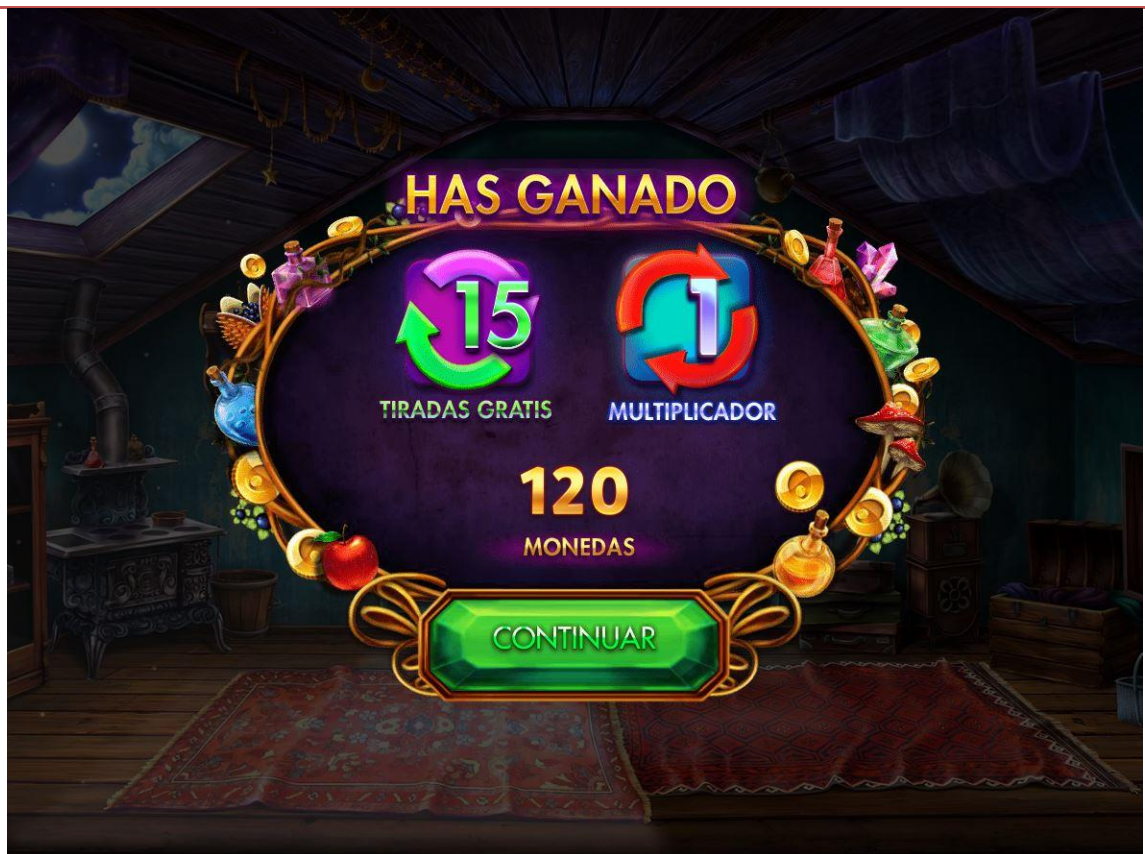
Premio durante fase de tiradas gratis