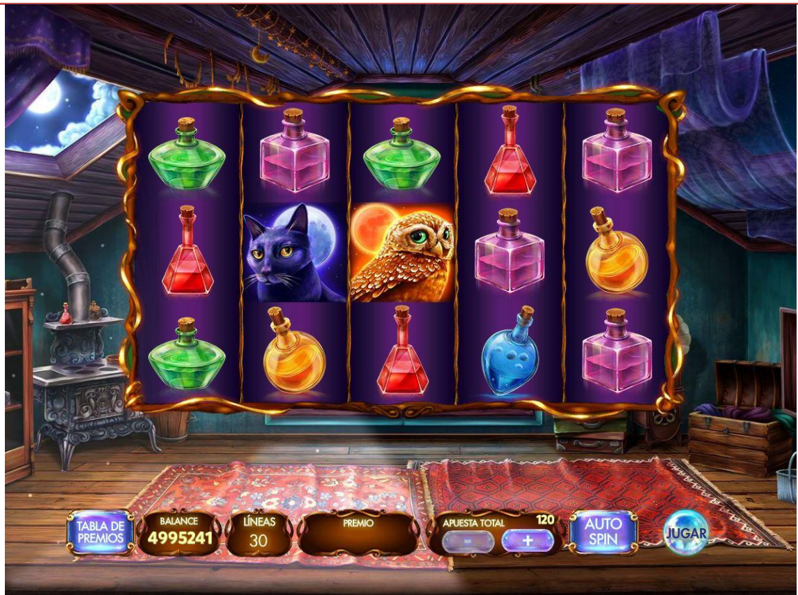
Máquina mostrando un premio