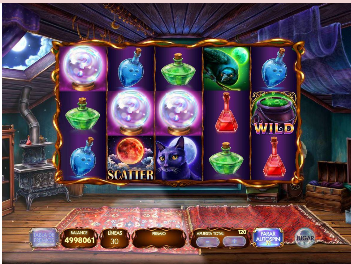
Tabla de premios – página 1