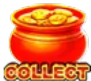
Símbolo de Collect