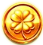
Símbolos de moneda