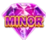
Símbolos de bonificación

Consiga un símbolo de Collect para activar la función Collect del juego base.