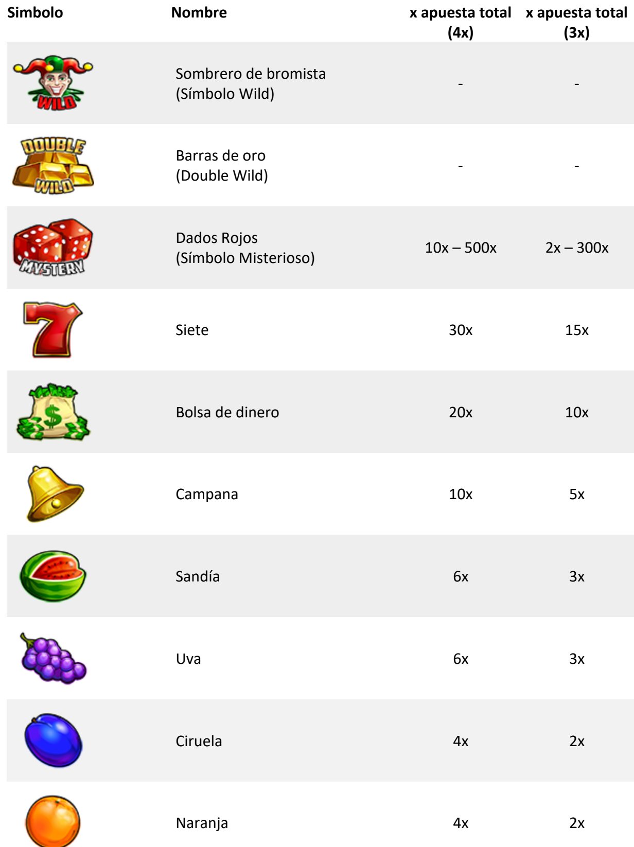
TABLA DE PAGOS