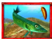
Tabla de premios

Los Wilds sustituyen a todos los símbolos, salvo al símbolo Bonus Scatter.