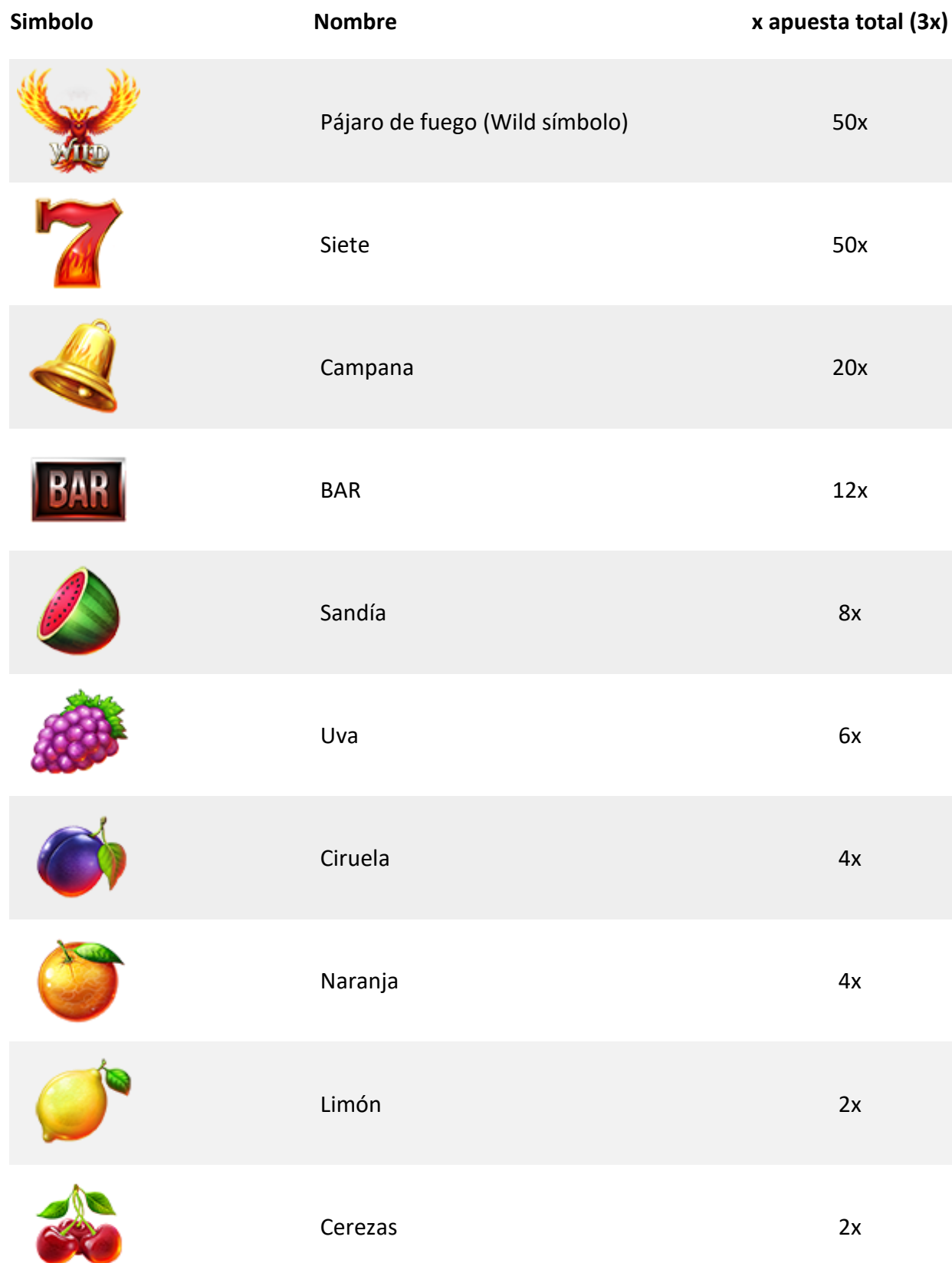
TABLA DE PAGOS