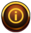
Tabla de pagos

Haga clic para ver las reglas del juego.