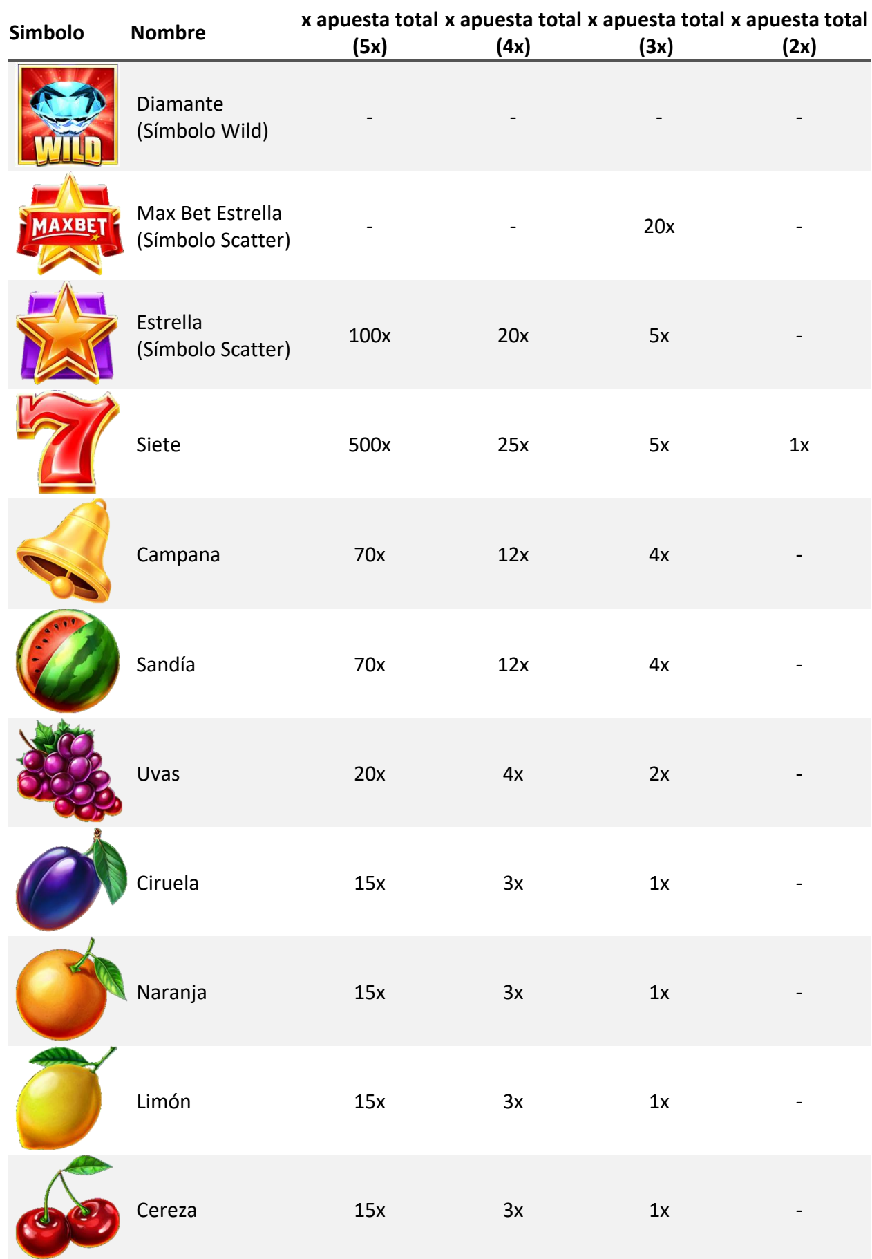
TABLA DE PAGOS