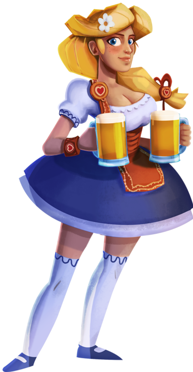
Imagen 10. Personaje de Elsa.