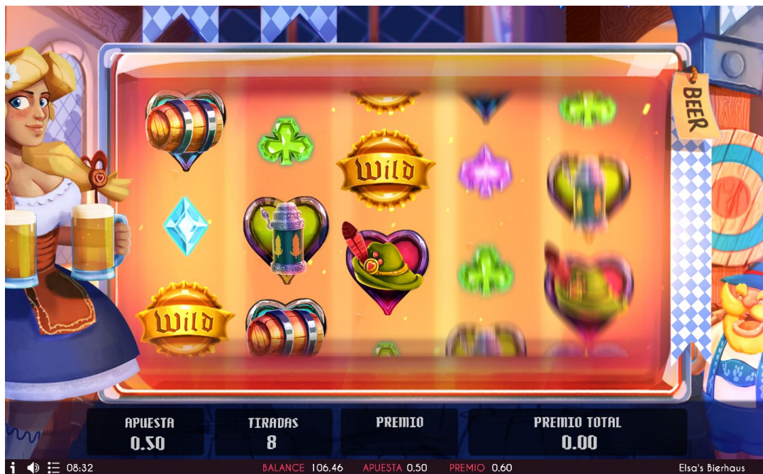
Imagen 9. Interfaz de juego durante la fase de tiradas gratis.