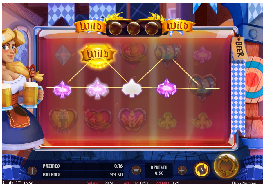
Imagen 5. Referencia visual de una línea premiada.

Además el juego tiene un minijuego de dardos a la que se accede cuando 3 símbolos Bonus (imagen 6) aparecen en cualquier posición de los rodillos (imagen 7).