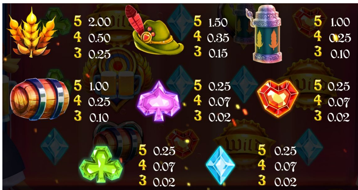
Imagen 3. Símbolos que ofrecen premios de línea. Por cada símbolo, los premios se muestran en grupos de 3, 4 o 5 símbolos. Ejemplo con una apuesta de 0.25 unidades monetarias.