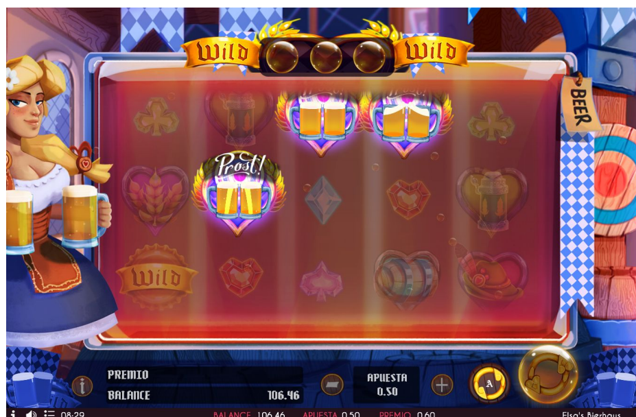
Imagen 7. Tirada de juego premiada con acceso al minijuego de dardos.