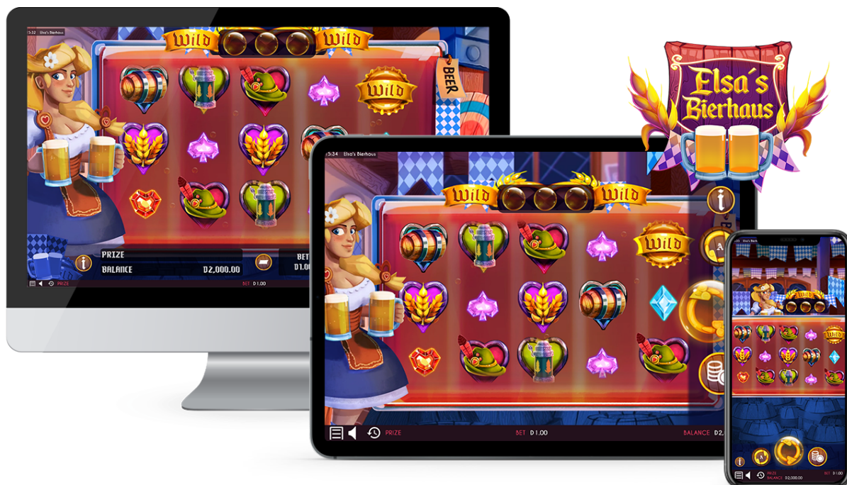
Imagen 1. Vista general de Elsa's Bierhaus en ordenadores y dispositivos móviles.

La ventana de juego muestra los rodillos en el centro de la pantalla. Por su parte, la interfaz de usuario se coloca en la parte inferior o en el lateral derecho, dependiendo del dispositivo. (Imagen 1).