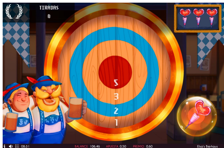
Imagen 8. Minijuego de dardos.