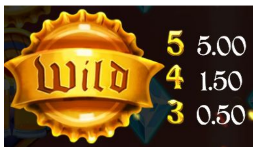
Imagen 4. Símbolo Wild. Ejemplo con una apuesta de 0.25 unidades monetarias.

Con cada premio obtenido se rellena media burbuja de las mostradas sobre los rodillos de juego además de generar un Respin. Si se consiguen premios consecutivos se irán rellinando las burbujas, creando un WILD bloqueado al completar cada una de ellas.