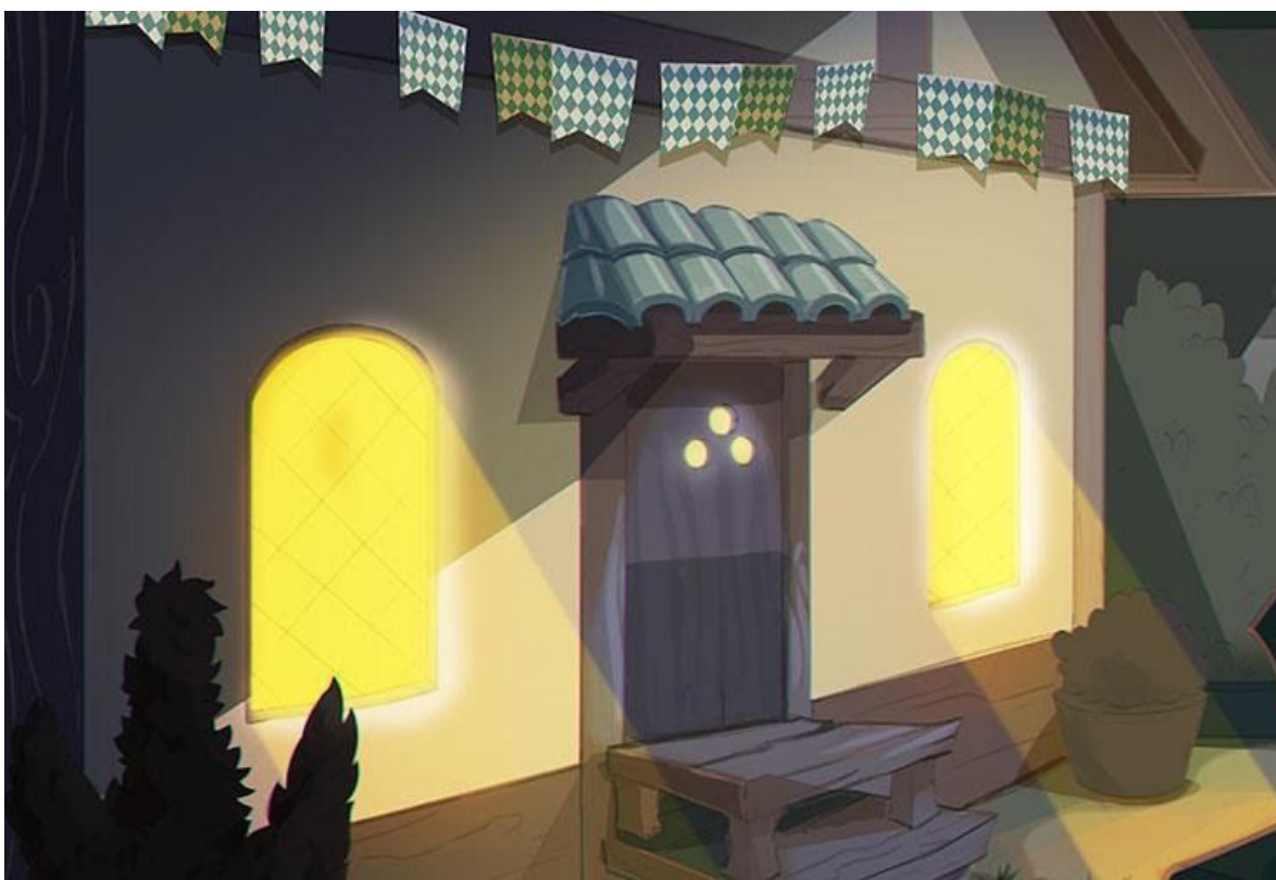
Imagen 11. Escenario principal.