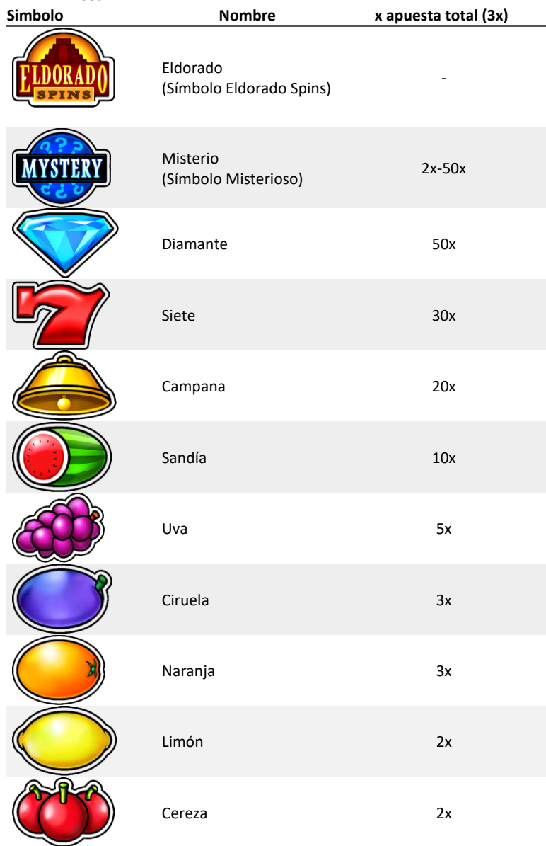
TABLA DE PAGOS