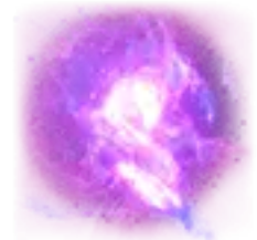
Orbe potenciador morado

Los orbes potenciadores verde y morado pueden salir en los tambores del juego base.