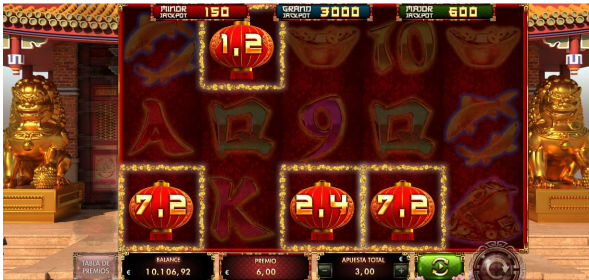
TABLA DE PREMIOS