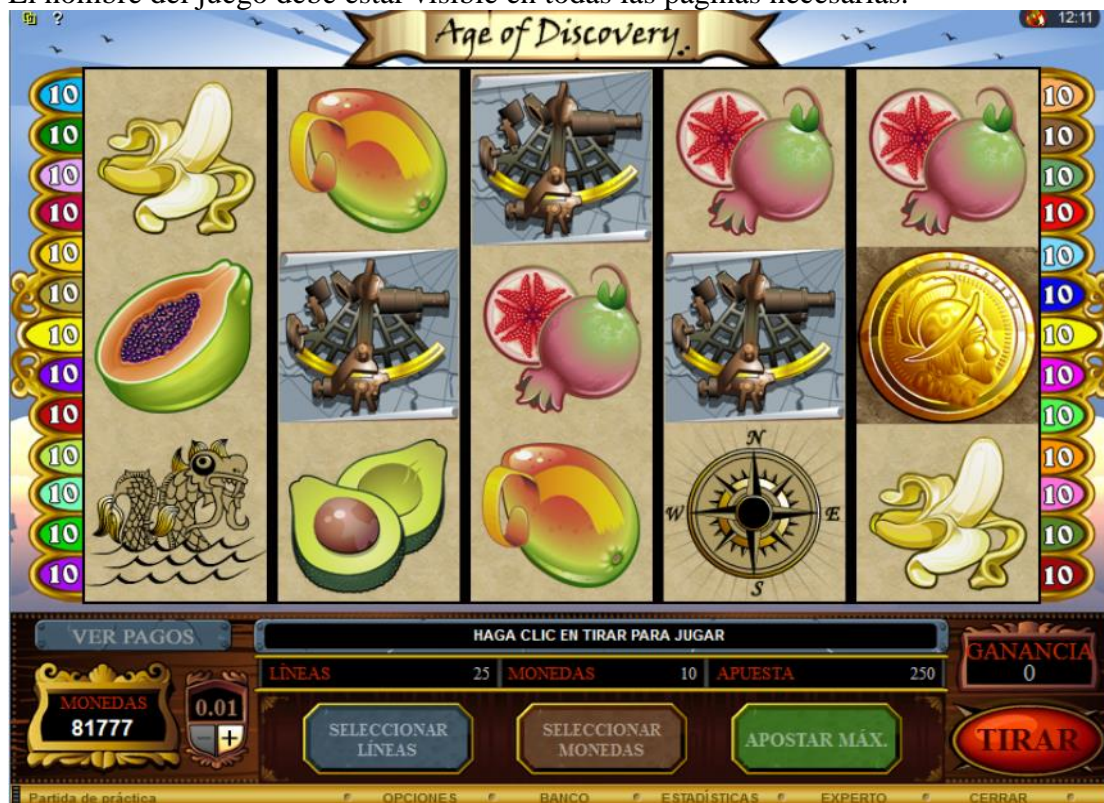
Figura 1: Juego base

El nombre del juego debe estar visible en todas las páginas necesarias.