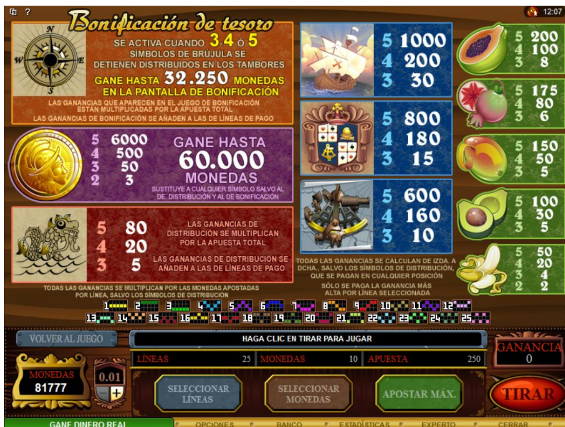
Tabla de premios 1