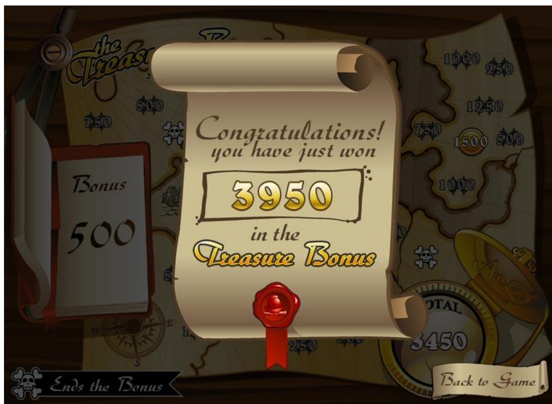
Figura 2: Gráficos de pantalla de bonificación