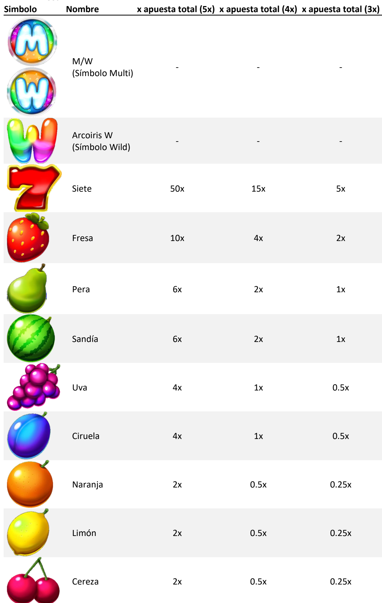
TABLA DE PAGOS