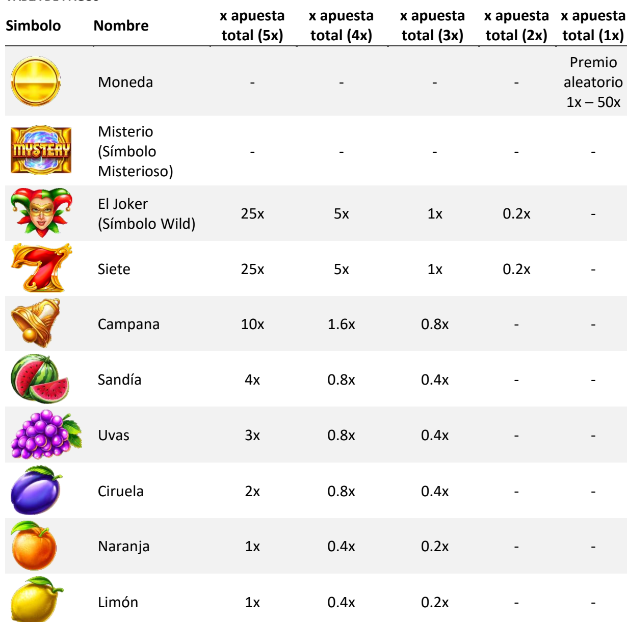
TABLA DE PAGOS